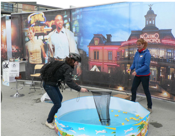
En norsk jente fiskar efter vinst i VisitSundsvalls tävling

I maj gick färden till Trondheim och i juni var det umeåborna som fick ett smakprov av vad Sundsvall erbjuder. Liksom i fjol är det VisitSundsvall som går i spetsen för resorna som görs tillsammans med aktörer från besöksnäringen. Syftet är att fiska upp fler besökare till Sundsvall. I år låg fokus på Himlabadet och i de påsar som delades ut på gator och torg fanns bland annat badankor och färgglada kommunicerande pratbubblor. 2 500 norrmän respektive 1 100 umebor fick därigenom en bit av Sundsvall direkt i handen. Satsningen gav omedelbart resultat i form av ökat antal besökare på webbplatsen visitsundsvall.se . Titta in du med!